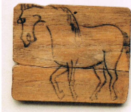
(写真2「伊場遺跡出土の絵馬」8.9×7.3cm)

人間を取り巻く動物はたくさんいる中で、何故「馬」でなければならないかという素朴な疑問が湧いてくる。その理由は馬が古代から神の乗り物として神聖視され、生きた馬が神馬として神に献上されていたことによる。山の神とされてきたのは猿で、「猿」が馬を曳く図は江戸時代の絵馬に多く見られる。『続日本記』の天平宝字7年(763)5月の記述に「長雨が続けているので雨を止まらせるために白馬を献上した」とある。また、『延喜式』(907年:平安中期の法令集)にも「祈雨の神であり止雨の神である丹生大神に降雨を祈る際は黒毛の馬、止雨を願う際は白毛(赤毛)の馬を神馬として奉る」と、同様の記述がある。